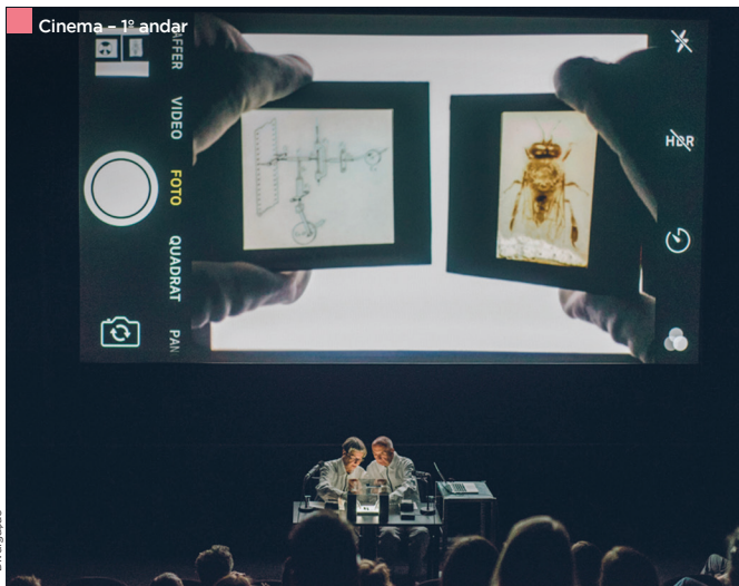
DAS LEBENDE BILD & DIE BIENZUCHT (The Living Image and the Beekeeping) 29.5.2017, Austrian Film Museum